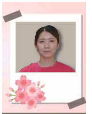
デイサービスセンター 阿光坊の郷

5月14日は母の日。デイサービス阿光坊では、日頃の感謝をこめて、スタッフ手作りのカーネーションをプレゼントしました。様々な柄の生地で作りました。好きな色、柄を選んで頂き、喜ばれておりました。皆様に、感謝でいっぱいです。いつも、ありがとうございます。これからも笑顔いっぱいにお返ししますように。