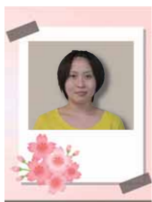
クルーズホーム あゆみの里

グループホームあゆみの里では、5月17日「花より団子会」を開催。浴衣を着て化粧をしたスタッフが大変身。「あなた誰だべ?」と不思議そうに見る入居者様に、説明すると大笑いしておりました。昼食は特別プレートで召し上がり「美味しい」と喜んでおられました。