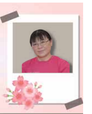
デイサービスセンター たんぽぽ

少しずつ暖かくなり、5月は七戸町の天王寺までつづじドライブへ外出しました。桜の開花と同じく、今年は10日程早く満開を迎えました。帰りは皆様お楽しみみの、道の駅に寄り道し、ソフトクリームやそば餅を堪能し帰園しました。