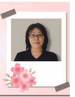
有科老人ホーム あゆみの里

4月中旬、いちよう公園や間木堤公園へ花見ドライブへ出かけました。外へ出掛ける機会が少なく、久しぶりの外出に喜ばれておりました。今年は例年より早く満開となり、予定を少し早め外出。風が強い日でしたが、風にも負けず綺麗に咲いていました。