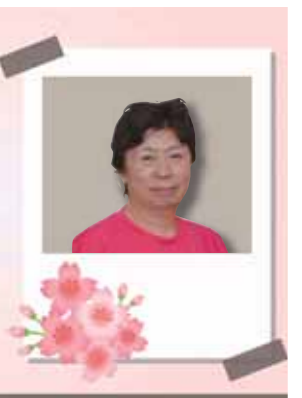
デイサービスセンター あゆみの里

デイサービスあゆみの里の5月は、こいのぼり吊るし飾り、藤の花の短冊、あじさいのしおりを利用者様と一緒に作りました。毎月、季節に合わせた製作を行っています。一人一人の個性が出ていて、とても楽しい作品となっております。